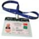
Kimlik ve Kimlik Askısı