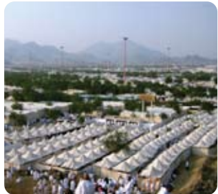
Arafat Meydanı / Mekke