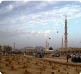
Cennetül Baki / Medine