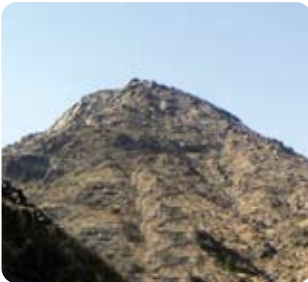
Sevr Dağı / Mekke