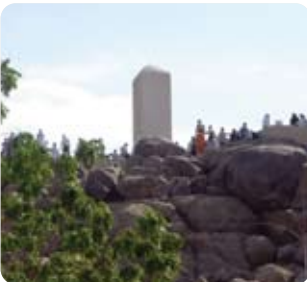
Arafat - Cebel-i Rahme / Mekke