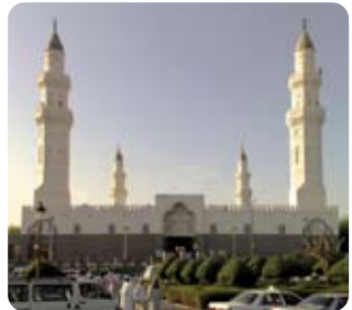
Kuba Mescidi / Medine