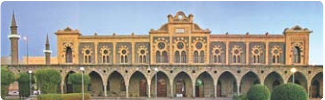
Anberiyeh Osmanlı Tren İstasyonu / Medine

Türkiye Finans Katılım Bankası - Üsküdar Şb. IBAN TR61 0020 6000 0800 4052 070102