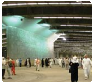
Mina - Şeytan Sembolünü Taşlama